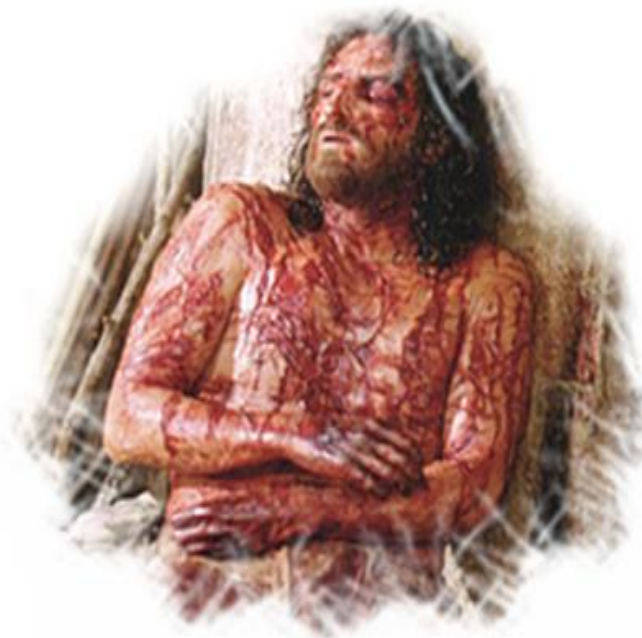
Fot. Na moim umęczonym ciele nie ma miejsca bez rany

Jestem tak bardzo biczowany grzechami ohydnych morderców (lekarzy i matek) zabijających swoich braci. Na Moim umęczonym ciele nie ma miejsca bez rany.