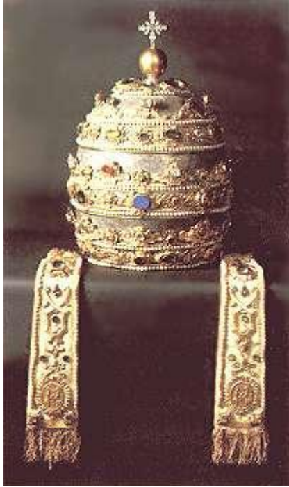
Tiara regularnie służy do okrycia watykańskiego pomnika św. Piotra. Kliknij na zdjęcie, na widok z bliska