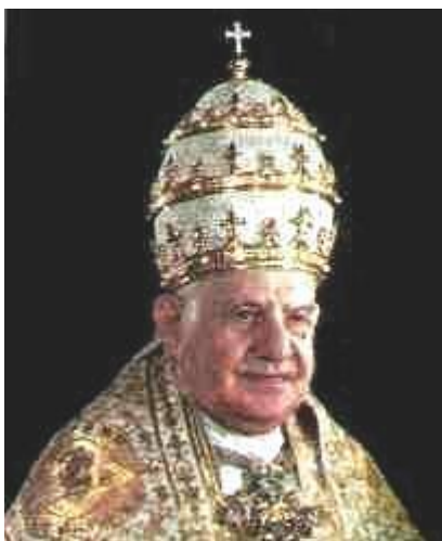
Jan XXIII noszący triregno koronę, wręczoną mu w 1959 roku

(#13. Hinc Papa triplici corona coronatur tanquam rex coeli, terre et inferorum.")