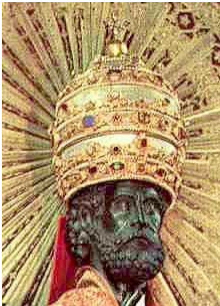
Po lewej jest srebro-pozłacany zestaw triregno , tiara z imitacją kamieni, która była używana od 1736 * , by ubrać pomnik św. Piotra w Bazylice Świętego Piotra w dniu 29 czerwca, w uroczystość św. Piotra i Pawła.

Źródło: Kościół widoczny, James-Charles Noonan, Jr, © 1996, opublikowanych przez Viking, Penguin Group, ISBN 0-670-86745-4, strona 189.