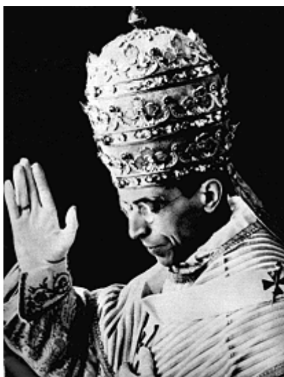
Pius XII noszący w 1877 tiarę Piusa IX

Gdyby ta frazeologia nie została uświęcona długotrwałą praktyką, nie byłoby również ukute w tym pokoleniu, aby wyrazić stosunek papieża do politycznego i społecznego porządku, ale w pierwszej kolejności, nie byłaby ona utworzona, gdyby nie oznaczała to co mówi – "Władca świata".